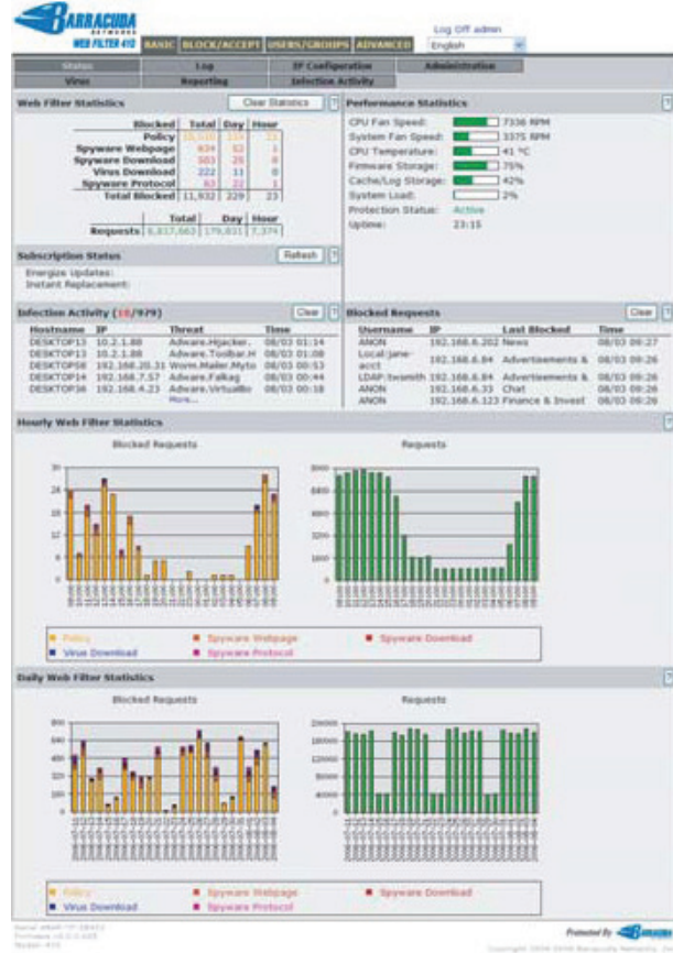
Barracuda Web Filter Altyapısı

Herhangi bir yüklemeye veya ağ modifikasyonu gerektirmeden Barracuda Web Filter'in kurulumu kolaydır. Üstün teknoloji merkezimiz Barracuda Central'da mühendislerimiz hiç durmadan yeni virüs tehditleri ya da yeni tip spyware'larla savaşmanın en etkin yollarını araştırır. En son spyware ile virüs tanımlamaları, içerik filtreleme kategorileri ve güvenlik güncellemeleri Energize Updates'le saatlik olarak otomatik olarak gerçekleştirilir.